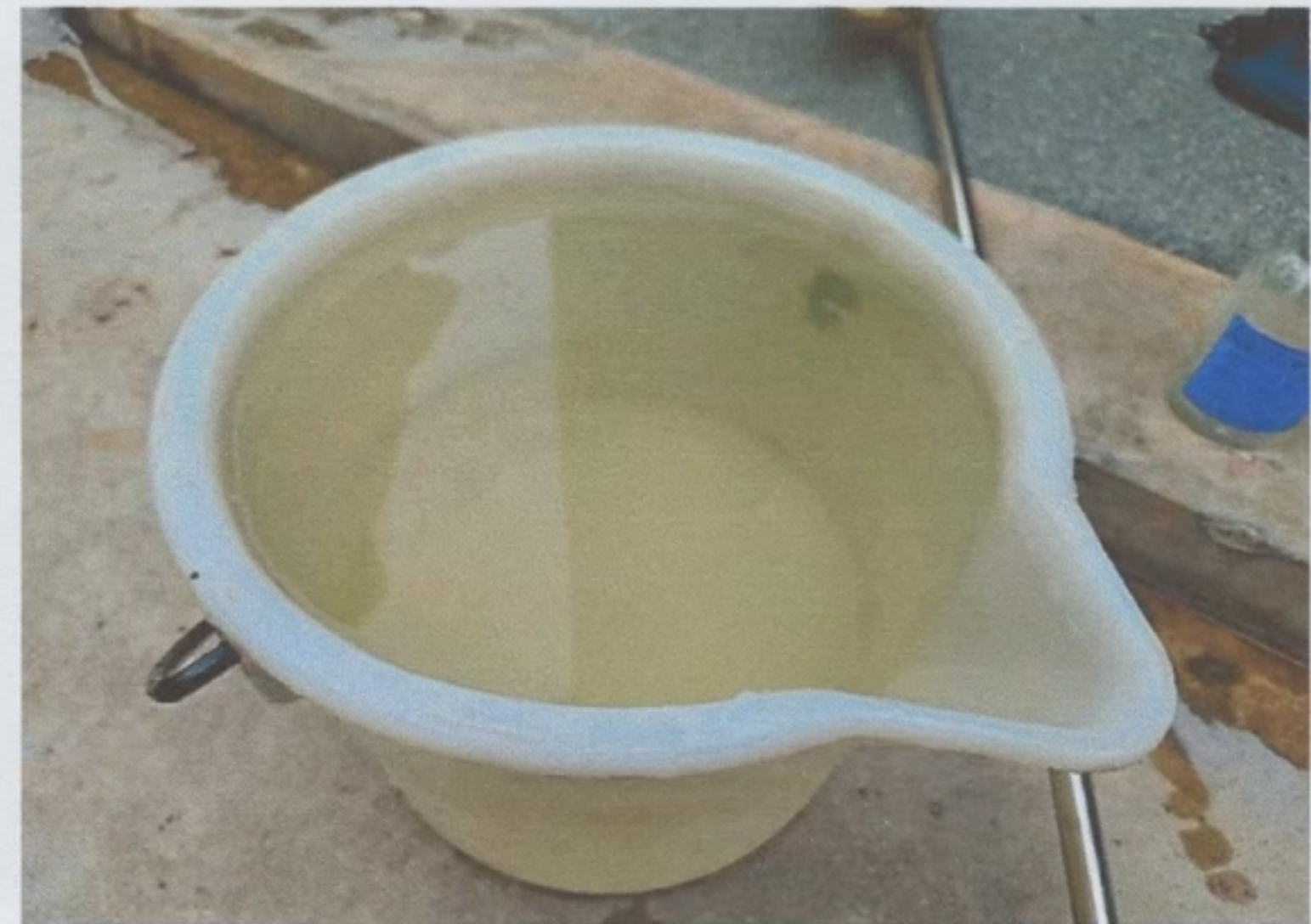
จุดเก็บตัวอย่างน้ำทิ้ง จุดที่ ๒ บ่อพักน้ำทิ้งที่จะระบายออกสู่ภายนอกของสถานีสูบน้ำริมถนนสามเสน