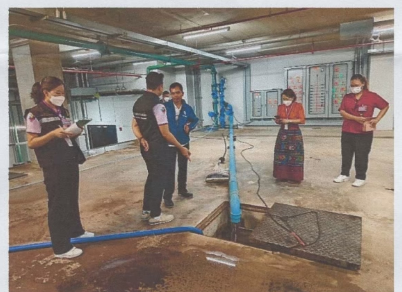
เจ้าหน้าที่ตรวจสอบระบบบำบัดน้ำเสียของอาคารรัฐสภาแห่งใหม่ สัปปายะสภาสถาน