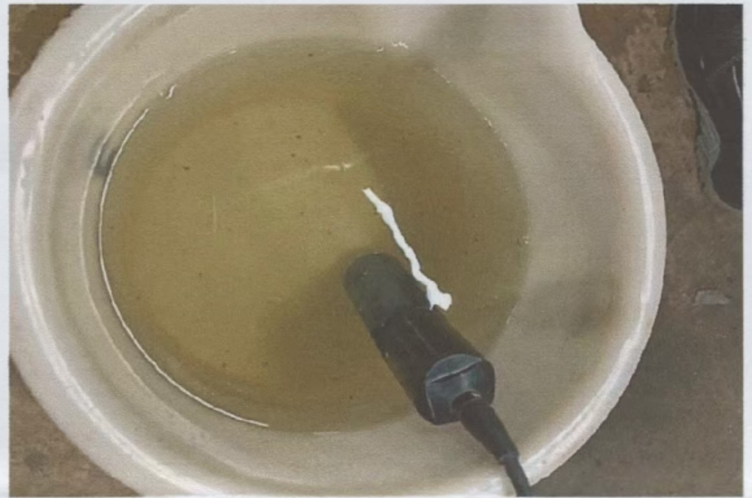
จุดเก็บตัวอย่างน้ำทิ้ง จุดที่ ๑ บ่อพักน้ำทิ้งของระบบบำบัดน้ำเสียที่จะระบายลงสู่รางระบายน้ำรอบอาคาร