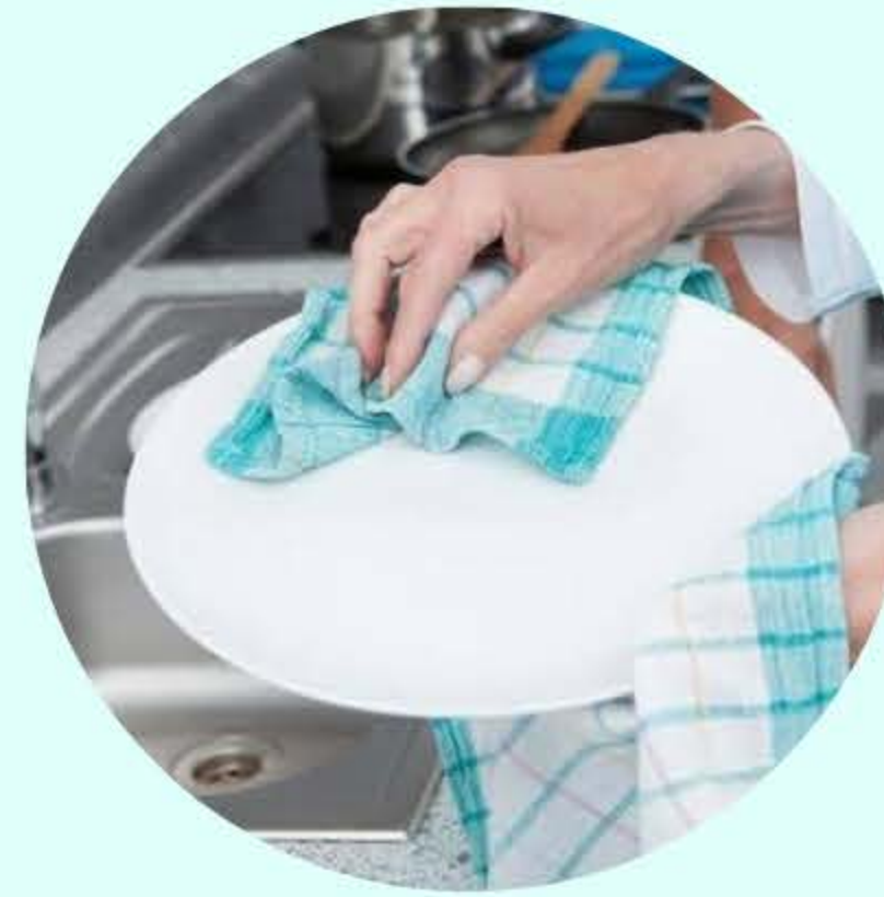
เช็ดให้แห้ง