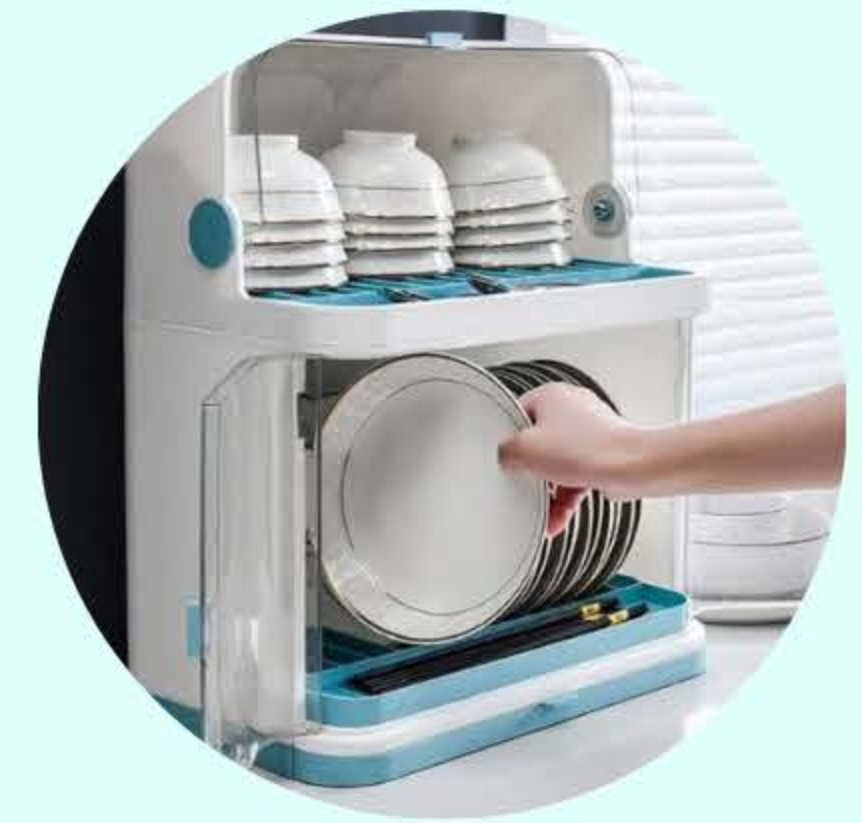
เก็บให้เรียบร้อย