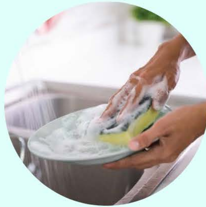
ล้างทำความสะอาด