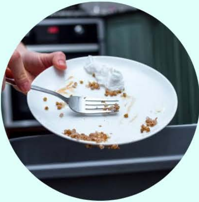
กวาดเศษอาหาร ลงถังขยะเศษอาหาร