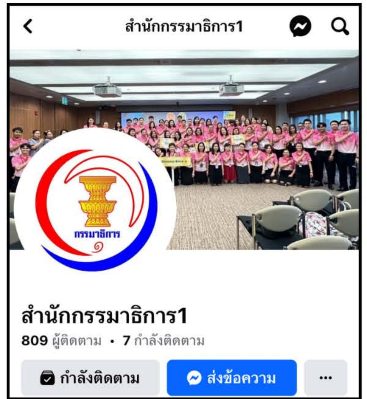
หน้าเพจเฟซบุ๊ก สำนักงานกรรมการ1