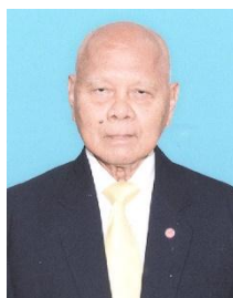
พลเอก อู๊ด เบื้องบน ที่ปรึกษาคณะกรรมาธิการ