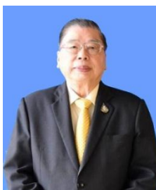
พันตำรวจตรี ยงยุทธ สารสมบัติ ที่ปรึกษาคณะกรรมาธิการ