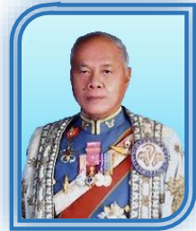
พลเอก ู้ด เบื้องบน ที่ปรึกษาคณะกรรมการ