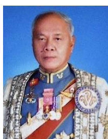
พลเอก อู๊ด เบื้องบน ที่ปรึกษาคณะกรรมการ