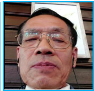
ภาพ - ขวา โดย ญัฐกานต์ - นพรินทร์