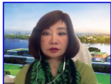
ภาพ - ขาว โดย ญัฐกานต์ - นพรินทร์