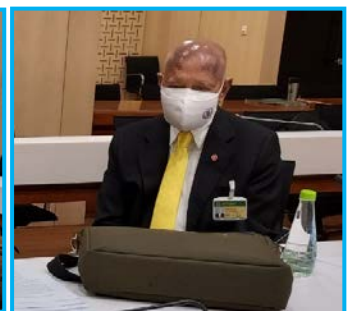
ภาพ - ขาว โดย เจตจำนงค์ - นพรินทร์