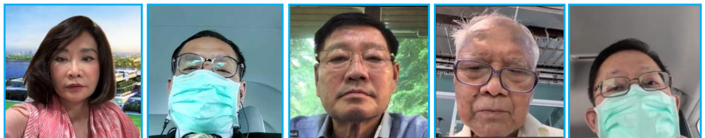
ภาพ - ขาว โดย ชาณุ - นพรินทร์