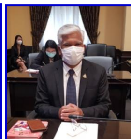
ภาพ - ข่าว โดย สิทธีชัย - นพรินทร์