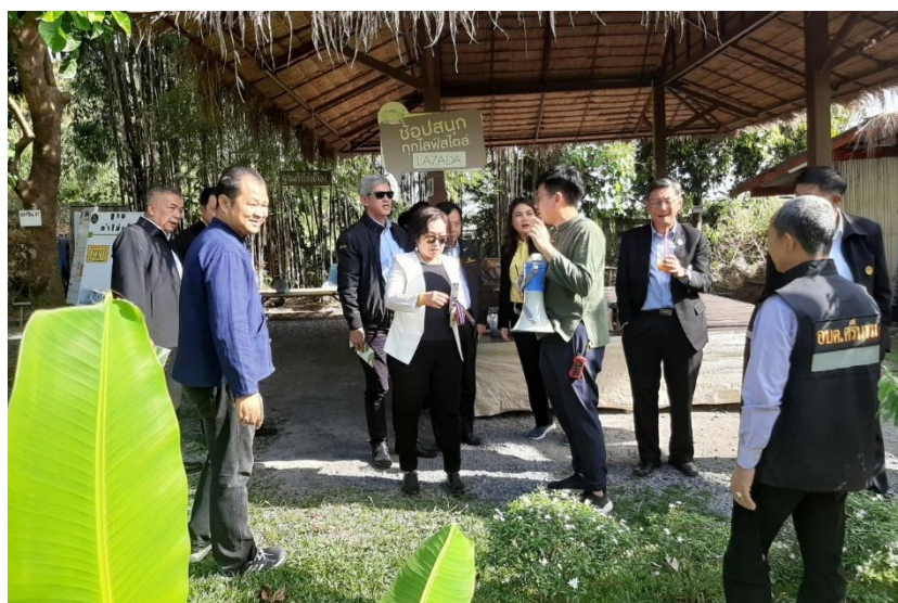
การลงพื้นที่เพื่อศึกษาดูงาน ณ ชุมชนท่องเที่ยว OTOP นวัตวิถี บ้านศิริวัน หมู่ที่ ๑ ตำบลศรีนาวา อำเภอเมืองนครนายก จังหวัดนครนายก