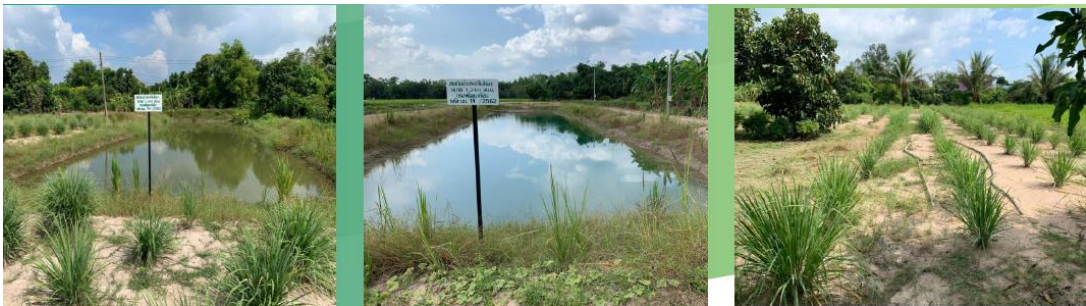
ภาพที่ ๔ แหล่งน้ำในไร่นา (บ่อจืด)

การขุดบ่อจืดเป็นการดำเนินการแก้ไขปัญหาน้ำแล้ง จากปัญหาฝนทิ้งช่วง โดยกรมชลประทาน มีระบบแพร่กระจายน้ำไม่เพียงพอ เกษตรกรได้รับความเดือดร้อนไม่มีน้ำใช้ ทำให้เกิดแนวคิดในการสร้าง บ่อจืดขึ้นในพื้นที่ของเกษตรกรเอง โดยปรึกษากับกรมพัฒนาที่ดินออกแบบบ่อจืดตามขนาดของพื้นที่ มีความจุตั้งแต่ ๕๐๐ คิว ๑,๐๐๐ คิว และ ๑,๕๐๐ คิว โดยประโยชน์ที่ได้รับจากการทำบ่อจืด คือ ประชาชนสามารถปลูกผักต่าง ๆ บริเวณรอบบ่อ นำออกขายได้วันละไม่ต่ำกว่า ๒๐๐ บาท นอกจากนี้ บ่อจืดยังส่งเสริมในเรื่องของโครงการเกษตรปลอดภัย เพราะน้ำในบ่อจืดส่วนใหญ่เป็นน้ำฝนจึงไม่ปนเปื้อนสารเคมี