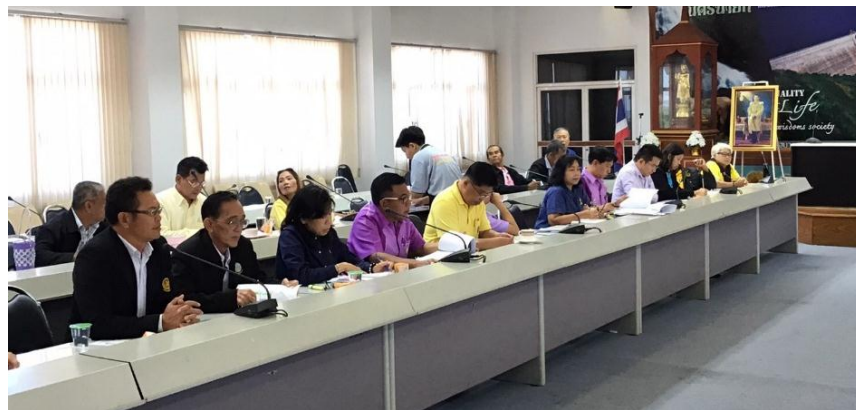
การหารือรับฟังความเห็นร่วมกับประชาชน ประเด็นปัญหาด้านการเกษตร (ดินเปรี้ยว อุทกภัย และภัยแล้ง)