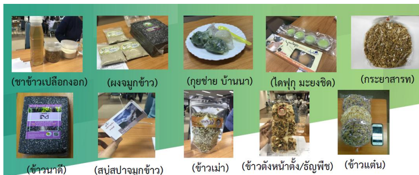
ภาพที่ ๒ การแปรรูปผลิตภัณฑ์จากข้าว

ผลไม้พื้นถิ่นของจังหวัดนครนายก ได้แก่ มะยงชิด มะปรางหวาน เป็นสินค้าบ่งชี้ทางภูมิศาสตร์ โดยสำนักงานเกษตรจังหวัดร่วมกับสถาบันเทคโนโลยีนิวเคลียร์แห่งชาติ (องค์การมหาชน) ได้ส่งเสริมการตลาดสารเคมีและการควบคุมแมลงวันผลไม้ ด้วยการนำเทคโนโลยีมาส่งเสริมและควบคุมทำหมันแมลงวันทอง และเพิ่มผลผลิตด้วยสารละลายไคโตซานฉายรังสี ส่งผลให้ผลไม้มีผลผลิตมากขึ้นไม่น้อยกว่า ๓๐ % โดยเริ่มศึกษาทดลองที่หมู่บ้านดงละคร แหล่งผลิตขนุนส่งออกตลาดมหานาค และแหล่งผลิตมะยงชิดขนาดใหญ่ รวมถึงนำนวัตกรรมมาช่วยให้มะยงชิดมีความหวานได้มาตรฐานการส่งออกและเพิ่มมูลค่าของมะยงชิด เนื่องจากมะยงชิดอ่อนไหวต่อฤดูกาลและสภาพภูมิอากาศ อีกทั้งมีการแปรรูปข้าวเพื่อเพิ่มมูลค่า โดยร่วมมือกับอุตสาหกรรมจังหวัด เกษตรจังหวัด ตัวอย่างผลผลิตที่ได้จากการแปรรูปจากข้าวคือ สบู่สปรายมูกข้าว ชาข้าวเปลือกงอก กุยช่ายบ้านนา ซึ่งเป็นกุยช่ายออแกนิก โดยใช้ข้าวพันธ์ กข ๔๓ เป็นต้น