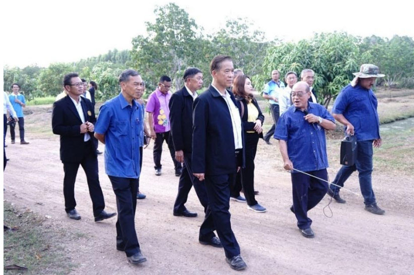
การลงพื้นที่เพื่อศึกษาดูงาน ณ โครงการศึกษาทดลองการแก้ไขปัญหาดินเปรี้ยว อันเนื่องมาจากพระราชดำริ ในที่ดินมูลนิธิชัยพัฒนา อำเภอบ้านนา จังหวัดนครนายก