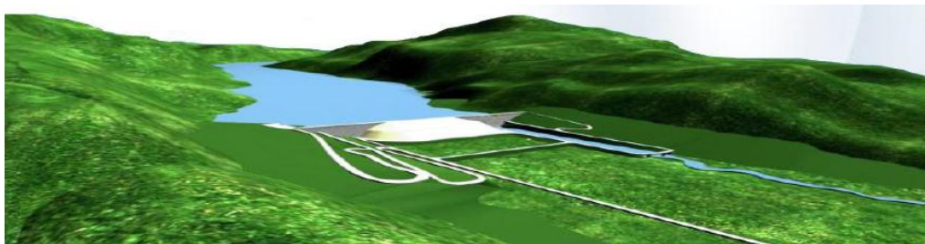
ภาพที่ ๕ อ่างเก็บน้ำคลองมะเดื่อ

อ่างเก็บน้ำคลองมะเดื่อ เป็นโครงการที่ในหลวงรัชกาลที่ ๙ รับสั่งให้ดำเนินการ โดยปัจจุบัน ได้เสนอเรื่องไปยังคณะรัฐมนตรี และคณะรัฐมนตรีได้เข้ามาติดตามให้เร่งดำเนินการ ซึ่งขณะนี้อยู่ในขั้นตอนของกรมชลประทานในการเข้ามาทำการศึกษาถึงผลกระทบสิ่งแวดล้อมและสุขภาพ (EHIA) โดยศึกษาจากโมเดลเขื่อนนฤบดินทรจินดา ซึ่งหากดำเนินการสำเร็จจะสามารถเพิ่มปริมาณน้ำได้มากกว่า ๘๕ ล้าน ลูกบาศก์เมตร