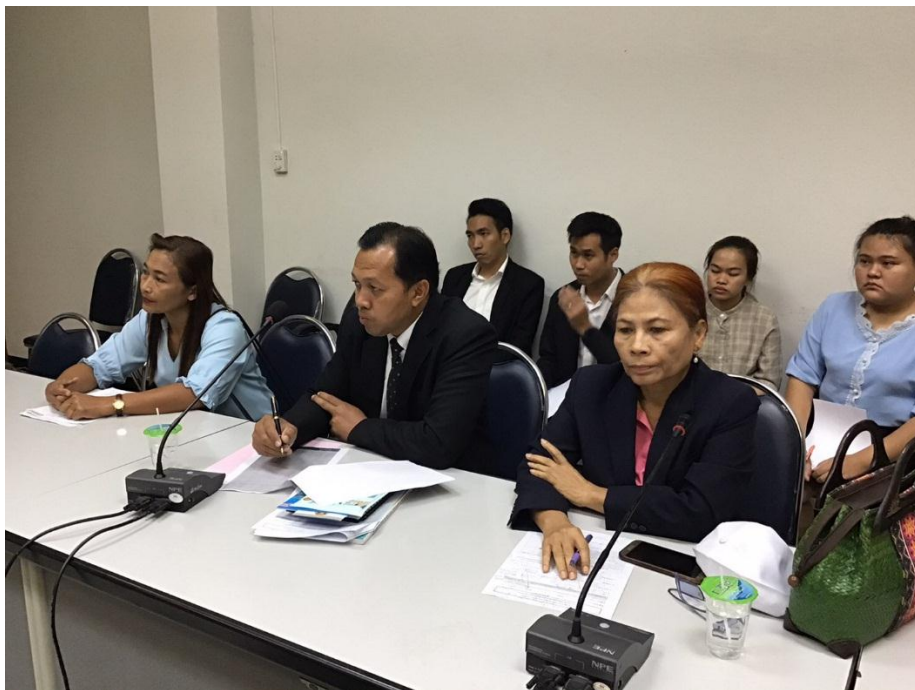
การหารือรับฟังความเห็นร่วมกับประชาชน ประเด็นด้านสังคม