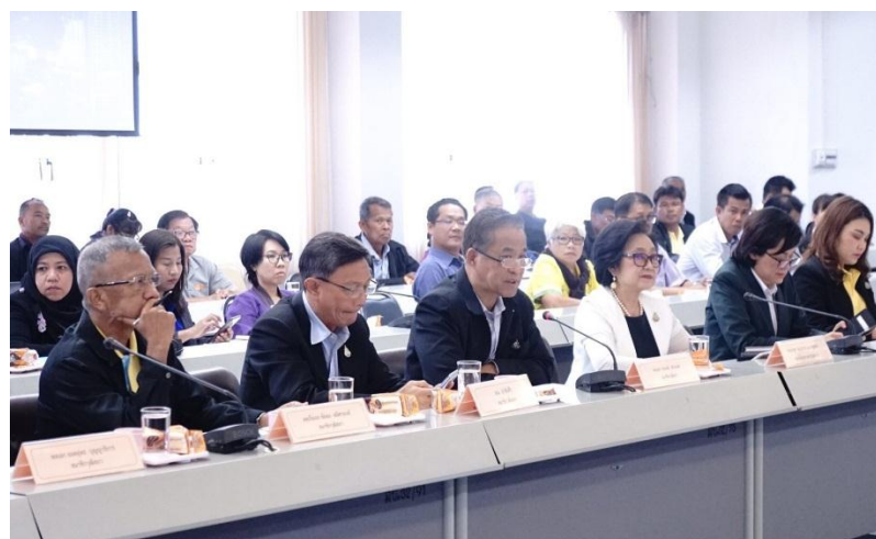
การหารือร่วมกับส่วนราชการและประชาชน ณ ศาลากลางจังหวัดนครนายก อำเภอเมือง จังหวัดนายก