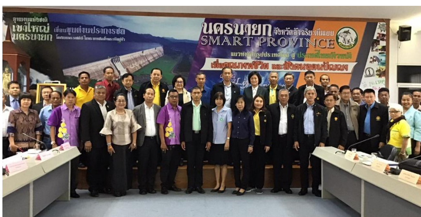
การหารือร่วมกับส่วนราชการและประชาชน ณ ศาลากลางจังหวัดนครนายก อำเภอเมือง จังหวัดนครนายก