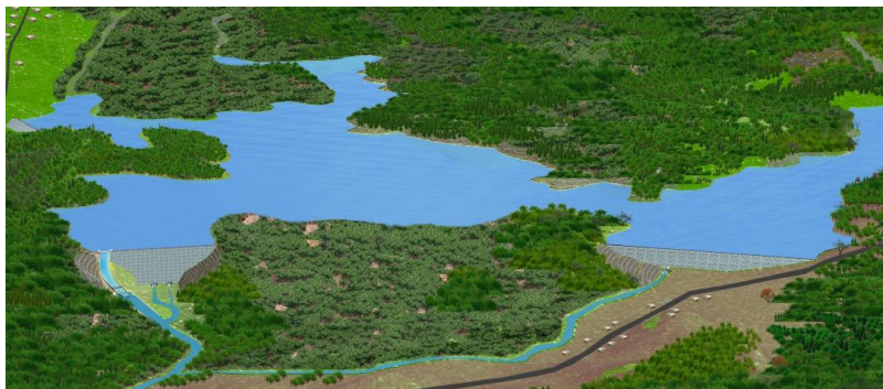
ภาพที่ ๖ โครงการอ่างเก็บน้ำคลองบ้านนา

โครงการอ่างเก็บน้ำคลองบ้านนา เป็นความต้องการของชาวบ้านกว่า ๓,๐๐๐ คน ในการเข้าซื้อร้องขอให้มีการแก้ไขปัญหาในเรื่องน้ำท่วมน้ำแล้ง โดยจะดำเนินการก่อสร้างในเขตพื้นที่อุทยานแห่งชาติเขาใหญ่ จังหวัดสระบุรี ทั้งนี้อุทยานแห่งชาติเขาใหญ่ได้ถูกประกาศให้เป็นส่วนหนึ่งของมรดกโลก จึงต้องทำการศึกษาและวิเคราะห์ถึงผลกระทบทั้งที่เกี่ยวข้องกับสิ่งแวดล้อมและผู้มีส่วนได้ส่วนเสียอีกเป็นจำนวนมาก