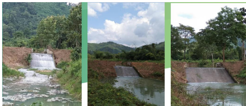
ภาพที่ ๓ ระบบกระจายน้ำสู่ชุมชนในพื้นที่อำเภอบ้านนา (โมเดลคลองห้วยถ่าน)

จังหวัดนครนายกมีระบบกระจายน้ำ การดูแลรักษาประตูเปิด-ปิดน้ำ โดยร่วมกับท้องถิ่นอำเภอบ้านนาและสถาบันปิดทองหลังพระ นำองค์ความรู้ไปเผยแพร่สอนให้ประชาชนและเจ้าหน้าที่ท้องถิ่นแก้ไขปัญหาน้ำกันเองในพื้นที่ โดยสอนวิธีการปรับปรุงประตูระบายน้ำ ทำให้การแก้ไขปัญหาเป็นไปด้วยความรวดเร็ว และผลที่ได้รับเป็นที่น่าพอใจ เพราะเกษตรกรมีน้ำใช้สำหรับการเกษตรมากขึ้น