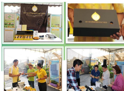
ภาพที่ ๑ การสร้างมูลค่าให้กับสินค้าเกษตร

เป็นการขับเคลื่อนการดำเนินงานเกี่ยวกับเกษตรปลอดภัย การแปรรูปสินค้าการเกษตร การพัฒนาผลไม้ในพื้นที่ การส่งเสริมนวัตกรรมทางการเกษตร มีการดำเนินงานด้านการเตรียมความพร้อม การเข้าสู่การรับรองมาตรฐาน GAP และโครงการอบรมให้ความรู้มาตรฐานเกษตรอินทรีย์ ให้เป็นไปตามมาตรฐาน Organic Thailand (เป็นเครื่องหมายรับรองปัจจัยการผลิต แหล่งการผลิต หรือผลิตภัณฑ์เกษตรอินทรีย์ ที่ได้รับการรับรองจากกรมวิชาการเกษตร กรมการข้าว กรมปศุสัตว์ และกรมประมง) และระบบการรับรองตนเอง โดยเกษตรกรร่วมกันกำหนดและรับรองขึ้น