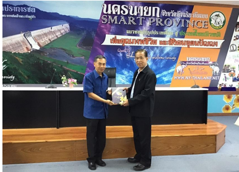
พลเอกวรพงษ์ ส่องเนตร ในฐานะหัวหน้าคณะ มอบของที่ระลึกให้กับผู้ว่าราชการจังหวัดนครนายก